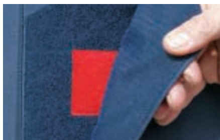
Das rote Klettband (o.) hilft beim richtigen Verschließen. Die Weste sollte immer den ganzen Rücken bedecken (u.).